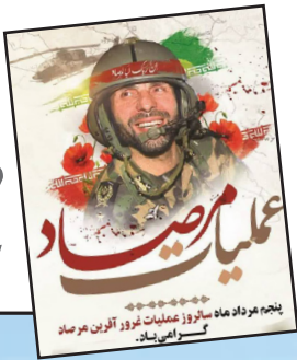
پانجم مرداد ماه سالروز عملیات غرور آفرین مرصاد گسوانی زاد.

«دنیای هوادار» از وضعیت قرمز «اشعه ماورای بنفش» در هفته جاری گزارش می دهد؛