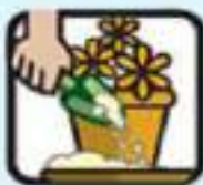
خشک کردن آب زیرگلدانی

برای اینکه در آب های راکد خانه جا خوش نکند: