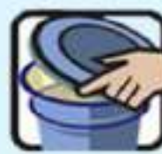
گذاشتن درپوش ظروف نگهداری آب