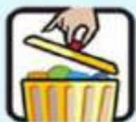
گذاشتن درپوشی سطل زباله