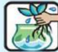
عدم نگهداری گیاه در آب