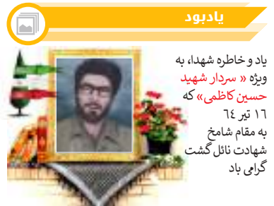
یاد و خاطره شهدا، به ویژه «سردار شهید حسین کاظمی» که ۱۶ تیر ۶۴ به مقام شامخ شهادت نائل گشت گرامی باد