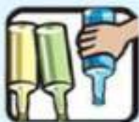
رها نکردن بطری و زباله در طبیعت