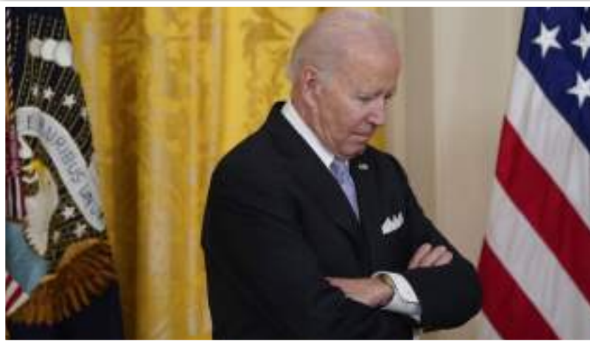
«سی‌ان‌ان» بررسی کرد؛