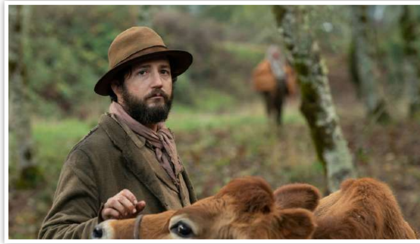
نگاهی به فیلم «نخستین گاو» از منظر مؤلفه‌های ژنریک؛