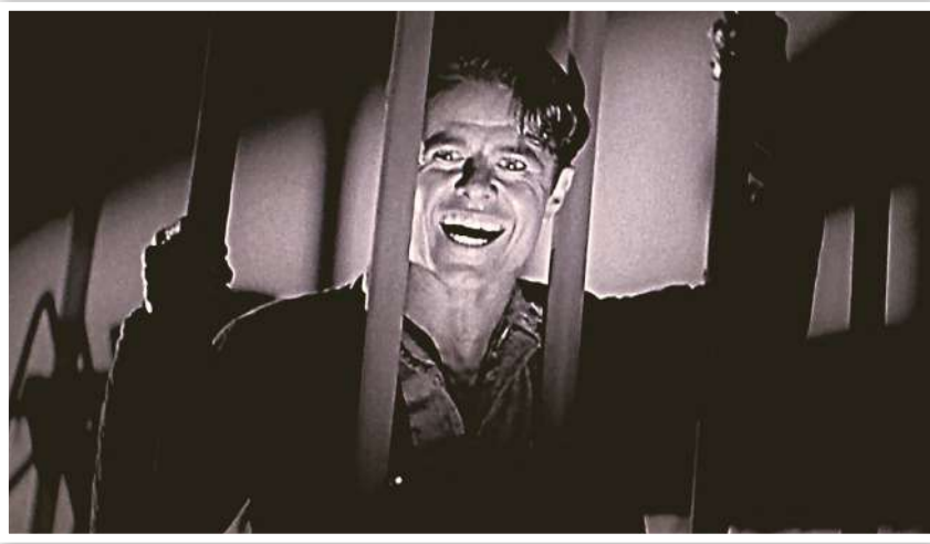
نگاهی به فیلم «غریبه‌ای در طبقه سوم» از منظر مؤلفه‌های گونه‌نوآور؛