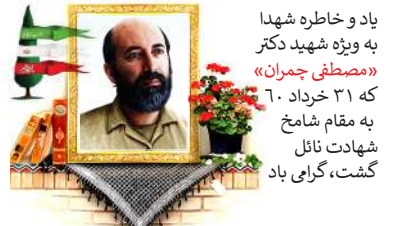
یاد و خاطره شهید به ویژه شهید دکتر «مصطفی چمران» که ۳۱ خرداد ۶۰ به مقام شامخ شهادت نائل گشت، گرامی باد