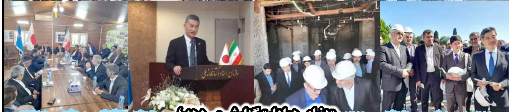
«دنیای هوادار» گزارش می‌دهد؟