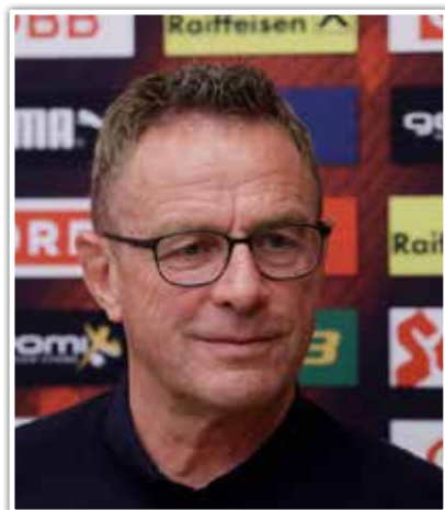
است که به من انگیزه می‌دهد. وقتی این دیگر به من انگیزه ندهد یعنی زمان بازنشستگی فرا رسیده است.