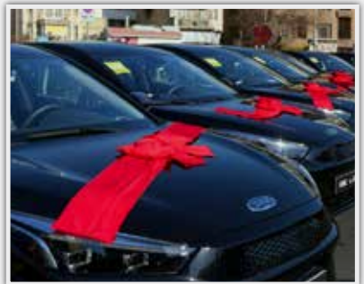
توافقنامه سازمان تاکسیرانی و شرکت مدیران خودرو برای جایگزینی ۲۰۰۰ دستگاه خودرو برقی با

وی افزود: رانندگان تاکسی با خودروهای با عمر ۱۰ سال به بالا می‌توانند نسبت به نوسازی اقدام کنند و به جای خودرو مصوب قبلی، خودرو جدیدی با بسته حمایتی مناسب دریافت کنند تا بتوانیم در راستای هوای پاک قدم برداریم. مالکی یادآور شد: چشم‌انداز