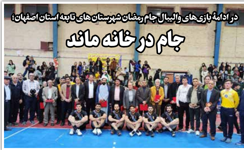
در ادامه بازی های والیبال جام رمضان شهرستان های تابعه استان اصفهان؛