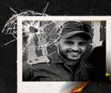
سرهنگ دوم سلمان حبه فرمانده گردان ۵۳ ارتش رژیم صهیونیستی / شمال غزه