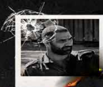
سرهنگ دوم علیم عبدالله جانشین فرمانده تیپ ۳۰۰ ارتش رژیم صهیونیستی / مرز لبنان