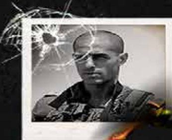
سرهنگ روعی یوسف لوی فرمانده یگان چند بعدی ارتش رژیم صهیونیستی / غزه