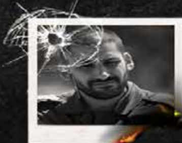
سرهنگ دوم ساهار تسیون مخلوف لشکر غزه و فرمانده گردان ارتباطات / غزه