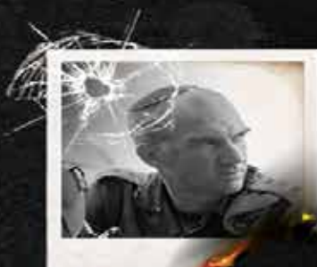
سرهنگ یوناتان اشتاینبرگ فرمانده تیپ ناحال / کرم ابوسالم