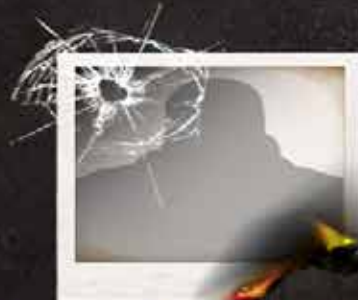
سرهنگ دوم میدان اسرائیل فرمانده تدارکات فرماندهی در فرماندهی جنوب / غزه