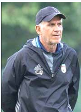
شرق آسیا شدند.

روایاتی که ایران در سر دارد را شاگردان کی روش بال و پر می دهند. حال «یوزها» خوب است. آنها جام می خواهند.