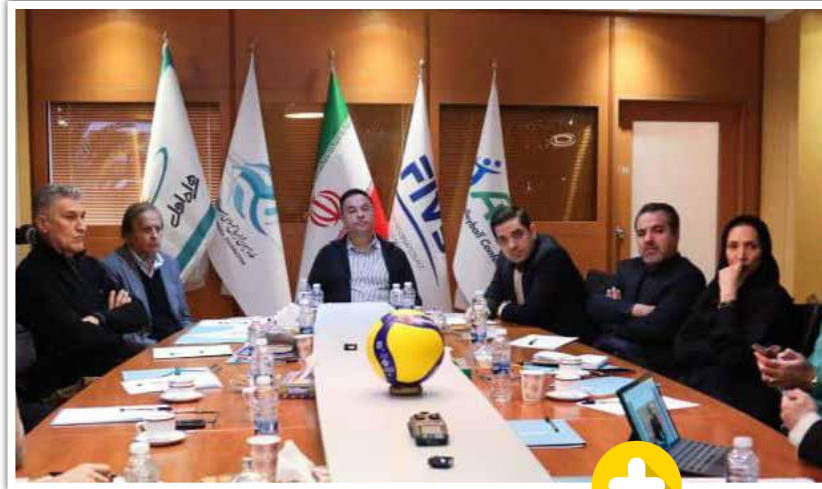
افراد غیر والیبالی که به فدراسیون والیبالی ایران صاحب پست و منصب شده‌اند و دو دستی به میز غصب شده چسبیده‌اند و حاضر نیستند به هیچ قیمتی از آن دل بکنند و شخصیتی در اندازه مقامی که با حرفه و تخصص آنها فاصله زیادی دارد، شده‌اند کارشناس والیبالی و سعی می‌کنند نظرات منفعت‌طلبانه خود را به بقیه القا کنند!

از قرار معلوم به نظر می‌رسد پریشانی والیبالی ایران را پایانی نیست! انگار پیمانی ارثی و ازلی بین این دو، بسته شده است و قرار نیست افراد سودجو و منافع طلب دست از سر این رشته ورزشی بر دارند!