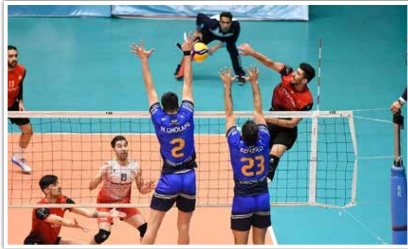
رقابت‌های لیگ برتر والیبال باشگاه‌های

کشور روز یکشنبه گذشته سوم دی ماه ۱۴۰۲ پس از برگزاری ۹۱ مسابقه با قهرمانی تیم فولاد سیرجان ایرانیان که با ۱۲ برد و یک باخت و کسب ۳۵ امتیاز در صدر جدول مسابقات قرار گرفت به پایان رسید. نگاهی گذرا به نیم فصل اول رقابت‌های لیگ برتر والیبال باشگاه‌های کشور با قهرمانی تیم پرستاره و ملی‌پوش فولاد سیرجان ایرانیان به اتمام رسید که توسط بهروز عطایی سرمربی مستعفی تیم ملی بزرگسالان هدایت می‌شود.