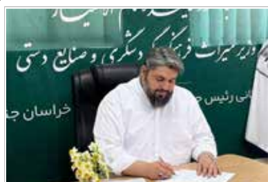
میراث فرهنگی، گردشگری و صنایع‌دستی به محل مذکور مراجعه کنند.

تمام‌الاختیار وزیر به مدت دو روز در محل اداره‌کل میراث فرهنگی استان واقع در بلوار چمران، نرسیده به میدان امام حسین، جنب دانشکده‌گان کشاورزی و منابع طبیعی پاسخگوی درخواست‌های مردم خواهد بود. او یادآور شد: شهروندان می‌توانند در روزهای ۱۵ تا ۱۷ آذر ماه از ساعت ۸ صبح الی ۱۸ برای ارائه و ثبت درخواست‌ها، انتقادات، پیشنهادات و شکایات خود در سه حوزه