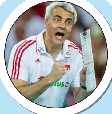
از نامزد همیشگی تا مربی مستعفی؛

تیم ملی فوتبال ایران با برتری ۳ بر یک برابر اردن، به فینال تورنمنت چهار جانبه این کشور رسید و در فینال باید برابر قطر با هدایت کی‌روش قرار بگیرد. به گزارش «دنیای هوادار» به نقل از ایسنا، تیم ملی فوتبال ایران در جریان نخستین دیدار خود در تورنمنت چهار جانبه اردن از ساعت ۲۱:۳۰ شب گذشته در ورزشگاه بین‌المللی امان به مصاف اردن رفت که در نهایت توانست این تیم را ۳ بر یک شکست دهد. با این نتیجه ایران راهی فینال شد و عصر سه‌شنبه به مصاف قطر با هدایت کارلوس کی‌روش می‌رود. در دقیقه ۶ این دیدار، بعد از یک کار ترکیبی قرمز پوشان ایران، پشت محوطه جریمه اردن توپ به مهدی طارمی رسید و این بازیکن هم با یک پاس در عمق سردار آزمون را صاحب توپ کرد و در ادامه آزمون با یک شوت پای راست گل نخست را برای ایران به ثمر رساند. در دقیقه ۲۷، با کار خوب جهانبخش و پاس این بازیکن، رامین رضاییان سمت راست محوطه جریمه اردن به توپ رسید و با یک پاس رو به عقب به درون محوطه جریمه، فرصت بسیار خوبی برای طارمی ایجاد کرد و طارمی هم با یک شوت پای راست گل دوم ایران را به ثمر رساند.