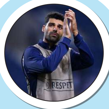
بمب خبری فوتبال ایران؛