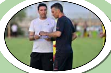
«رجبی» دستیار نگونام شد؛

تاریخ انتشار نوبت دوم: ۱۴۰۲/۰۴/۱۷ سازمان حمل و نقل بار و مسافر شهرداری فردیس شناسه آگهی: ۱۵۱۸۵۶۵