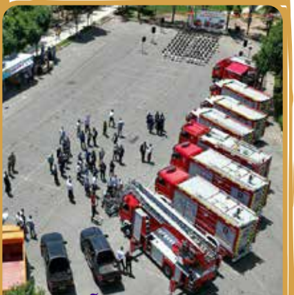
رونمایی از تجهیزات آتش نشانی