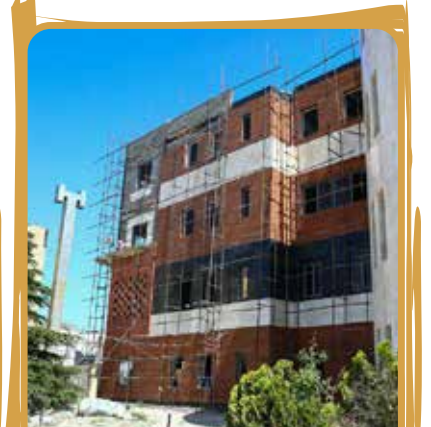
ساختمان ستاد مرکز شهرداری فردیس