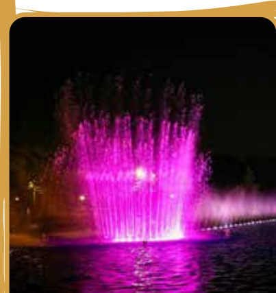
آبنمای موزیکال در پارک تندرستی