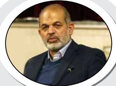
وزیر کشور به مجلس گزارش داد: «پایان ارائه خدمات» به بی‌حجاب‌ها!

«محمد صالح جوکار» رئیس کمیسیون شوراهاي مجلس شورای اسلامی - با اشاره به نشست این کمیسیون گفت: در جلسه، احمد وحیدی، وزیر کشور با حضور در کمیسیون گزارشی از اجرای طرح عفاف و حجاب توسط فراجا به اعضای کمیسیون ارائه کرد. در این گزارش، ضمن تأکید بر فرهنگ‌سازی در حوزه عفاف و حجاب عنوان شده بود که به جای برخورد فیزیکی، برخورد هوشمندانه در طرح عفاف و حجاب در دستورکار فراجا قرار گرفته است. وزیر کشور گفت کسانی که مرتکب کشف حجاب در سطح جامعه شوند و یا بی‌حجاب و بدحجاب داشته باشند، ابتدا به صورت پیامکی تذکر دریافت می‌کنند. وزیر کشور عنوان کرد که بعد از تذکر پیامکی، در صورت اصرار فرد بر عدم رعایت حجاب در مراکز خدمات عمومی، به این قبیل افراد خدمتی ارائه داده نمی‌شود و در صورت اصرار افراد به عدم رعایت حجاب پس از این مرحله موضوع برای بررسی بیشتر به قوه قضائیه ارسال خواهد شد. همچنین در گزارش وزیر کشور آمده بود که واحدهای صنفی که در آن‌ها عفاف و حجاب رعایت نشود، پلمب می‌شوند.