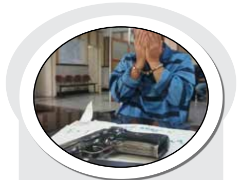
«معاون مبارزه با جرایم جنایی پلیس آگاهی»

در تحلیل، تنها برآیند عملکرد می‌تواند ما را به قضاوت برساند؛ نتیجه‌ای حاصل از مستندات و انصاف، یعنی ادله‌ای قابل اعتنا مبتنی بر داده‌های عینی با در نظر گرفتن تمام شرایط. طبق این تعریف، تحلیل درست، عرضه اطلاعات مستند با تنظیم ترازوی قضاوت در مقام انصاف است، آن هم در فرآیندی به‌دور از جعل و غلو. استقلال «ریکاردو ساپینتو» مدت‌هاست اسیر سوءمدیریت شده، با ناکارآمدی حضور در رقابت‌های آسیایی را از دست داده و امروز غرق در حواشی‌ای خودساخته است، آن هم با تیمی که نه تنها در ابتدای فصل توسط سرمربی‌اش بسته نشد، بلکه با بی‌تدبیری از تقویت نیم‌فصل هم محروم ماند، اما کدام مربی را سراغ دارید که از این شرایط گله نکند؟ پای کار بماند و بهانه نتراشد؛ اگر چه محبوبیت امروز پرتغالی نیز، برگرفته از همان عملکرد اوست، او در کنار «نالیق»ترین‌ها از استقلال، یکی از باکیفیت‌ترین تیم‌های سال‌های اخیر فوتبال ایران را ساخته، با هویت تیمی درخشان، بی‌محایا و زهدار در فاز تهاجمی و با انتظام ساختار دفاعی که حتی اگر این روند کم‌نظیر به قهرمانی ختم نشود، ارزش کار او را نتزل نخواهد داد، او، اعتماد هواداران استقلال را با ایمانش کسب کرده، ایمانی از جنس تلاش در عین ناامیدی. و این میراث ساپینتو است. بله! او، «ریکاردو» است، شریف، نجیب و شاداب که می‌تواند رؤیایا را «آبی»تر رنگ‌آمیزی کند و این بهانه‌ای است برای بیشتر دوست داشتنش.