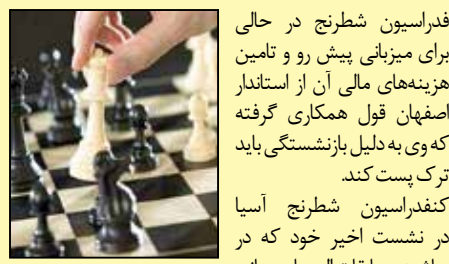
فدراسیون شطرنج در حالی برای میزبانی پیش رو و تامین هزینه‌های مالی آن از استاندار اصفهان قول همکاری گرفته که وی به دلیل بازنشستگی باید ترک پست کند.

کنفدراسیون شطرنج آسیا در نشست اخیر خود که در حاشیه مسابقات المپیاد جهانی به میزبانی باتومی گرجستان برگزار شد، امتیاز میزبانی رقابت های انفرادی آسیا در سال ۲۰۱۹ میلادی را به ایران واگذار کرد. در همین راستا و طبق توافقاتی که میان مهرداد پهلوان زاده رئیس فدراسیون شطرنج با محسن مهرعلیزاده استاندار اصفهان صورت گرفته، قرار است بهمن ماه و همزمان با ایام دهه فجر و چهلمین سالگرد پیروزی انقلاب اسلامی، این رقابت ها در اصفهان برگزار شود.