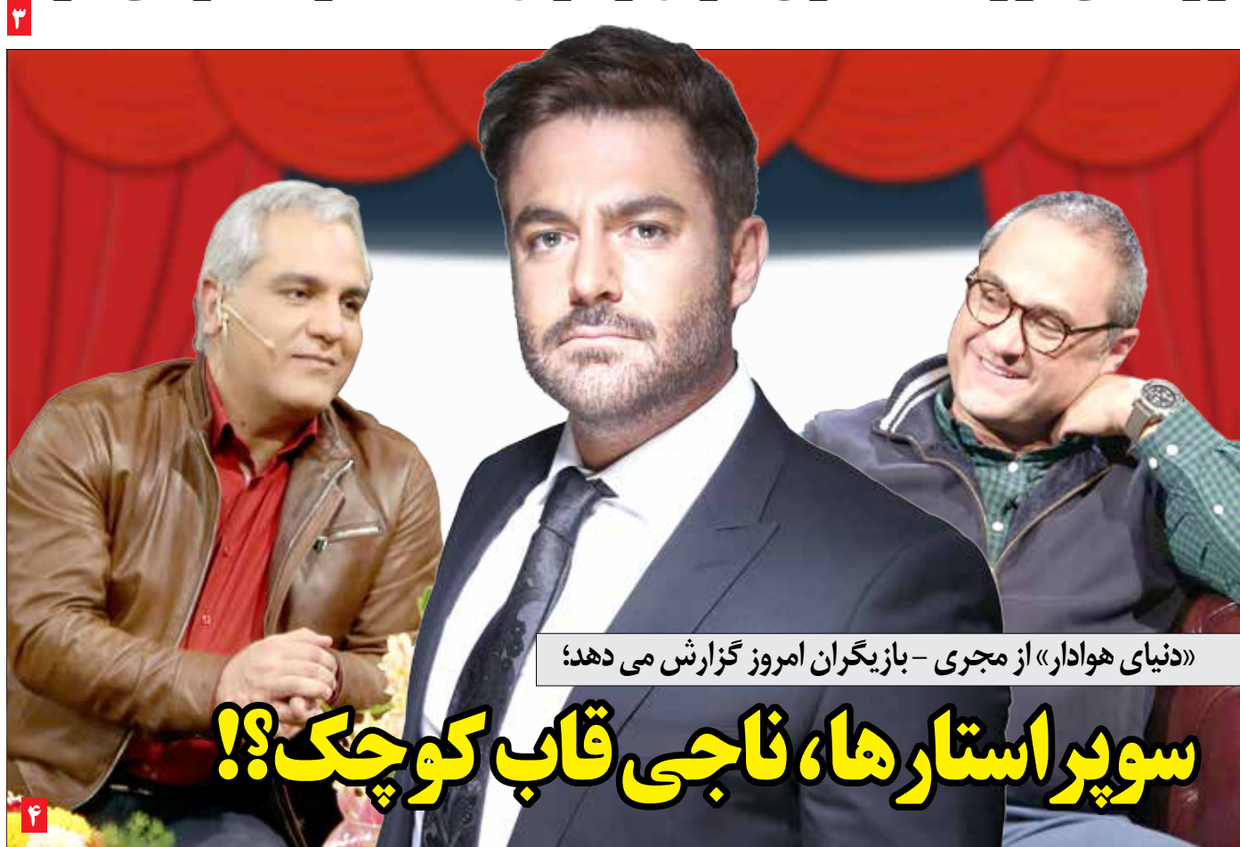
«دنیای هوادار» از مجری - بازیگران امروز گزارش می دهد؛