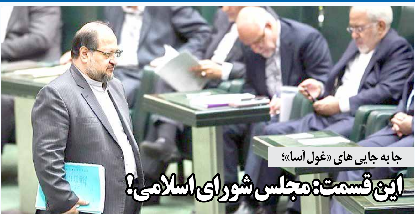
جا به جایی های «غول آسا»؛

پیش بینی می شود تدوین این مجموعه تا بهار سال آینده به طول بینجامد.