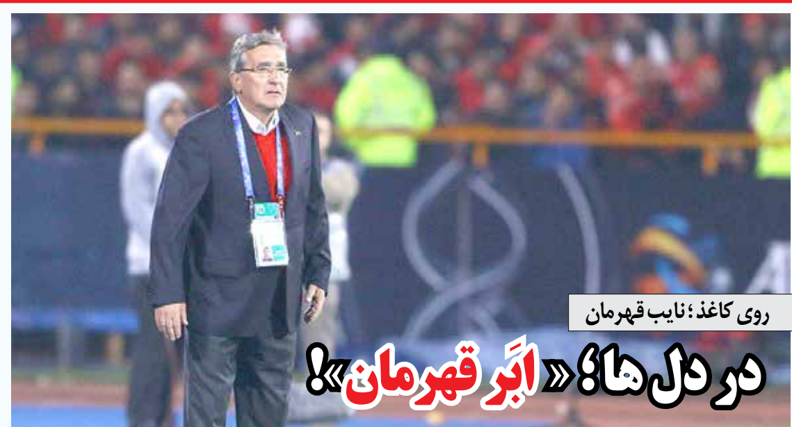
روی کاغذ؛ نایب قهرمان