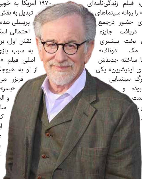
سینما و تئاتر

«خانواده فیلمن» را روانه سینماهای جهان کرده، برای حضور در جمع پنج کاندیدای دریافت جایزه اسکار کارگردانی بخت بیشتری دارند. «مارتین مک دوناف» بریتانیایی هم با ساخته جدیدش به نام «بان‌شی‌های اینیشیرین» یکی از پدیده‌های بزرگ سینمایی امسال جهان بوده و نه فقط در قسمت فیلمنا مه نویسی، بلکه کاندیدای اسکار خواهد شد بلکه نامزدی‌اش برای جایزه برترین کارگردانی هم تقریباً قطعی به