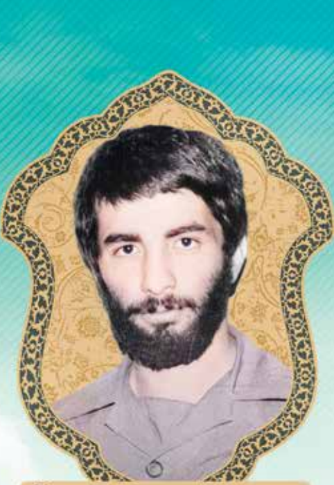
شهید محمد علی جهان آرا