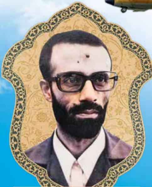
شهید یوسف کلاهدوز