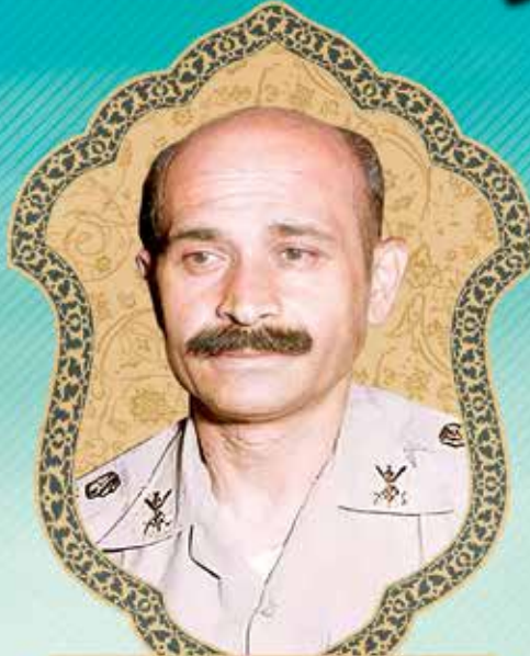
شهید سرلشکر ولی الله فلاحی