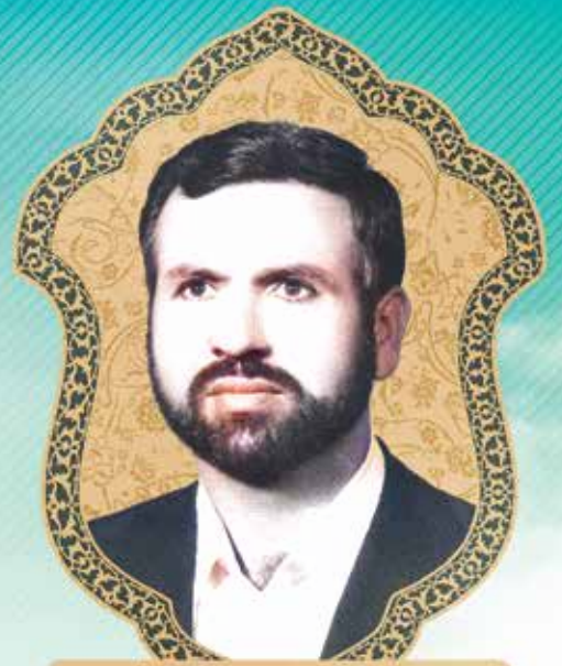
شهید سرتیپ موسی نامجو