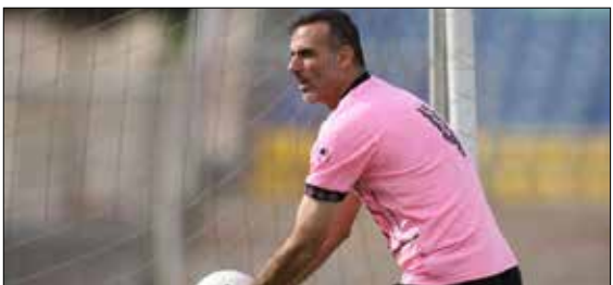
مدرک مربیگری معضل شد؛