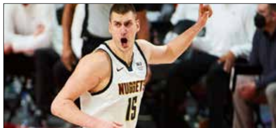
به ارزش ۶۰ میلیون دلار؛