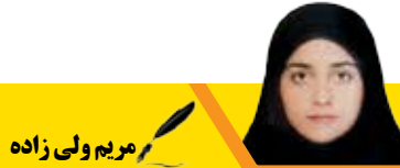
مریم ولی زاده

وزیر تعاون، کار و رفاه اجتماعی با انتشار توییتی استعفای خود را به رئیس جمهوری تقدیم کرد.